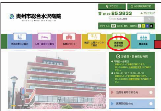
当院ホームページ

※なお、9月より受託検査申込書にも変更がございます。変更内容なども合わせまして、当院ホームページ上に詳しいご説明がございます。ご確認をお願い致します。