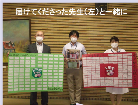
届けてくださった先生(左)と一緒に