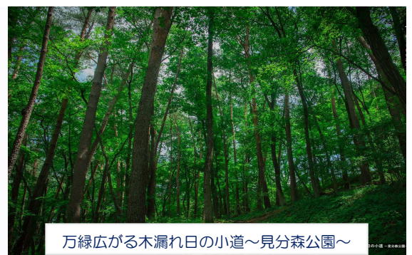
万緑広がる木漏れ日の小道～見分森公園～

〒023-0053 岩手県奥州市水沢大手町三丁目1番地 電話 0197-25-3833 (内線257) FAX 0197-25-4012 (医療連携室直通) ホームページ http://www.mizhsp-iwate.jp